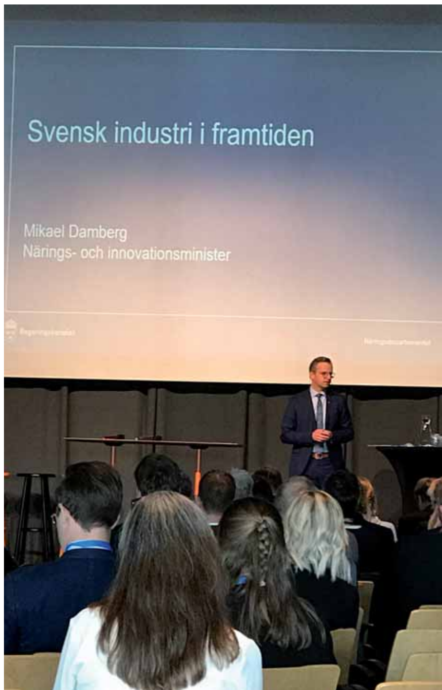
Närings- och innovationsminister Mikael Damberg under konferensen Digitalisera nu!

Alla talade om de satsningar som nu görs för digitalisering och vikten