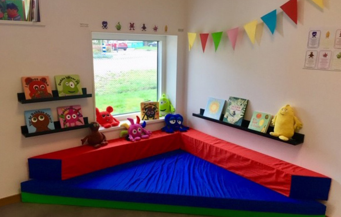
Bilden nedan: Fantasi. Bilden ovan: Läs och lugn.