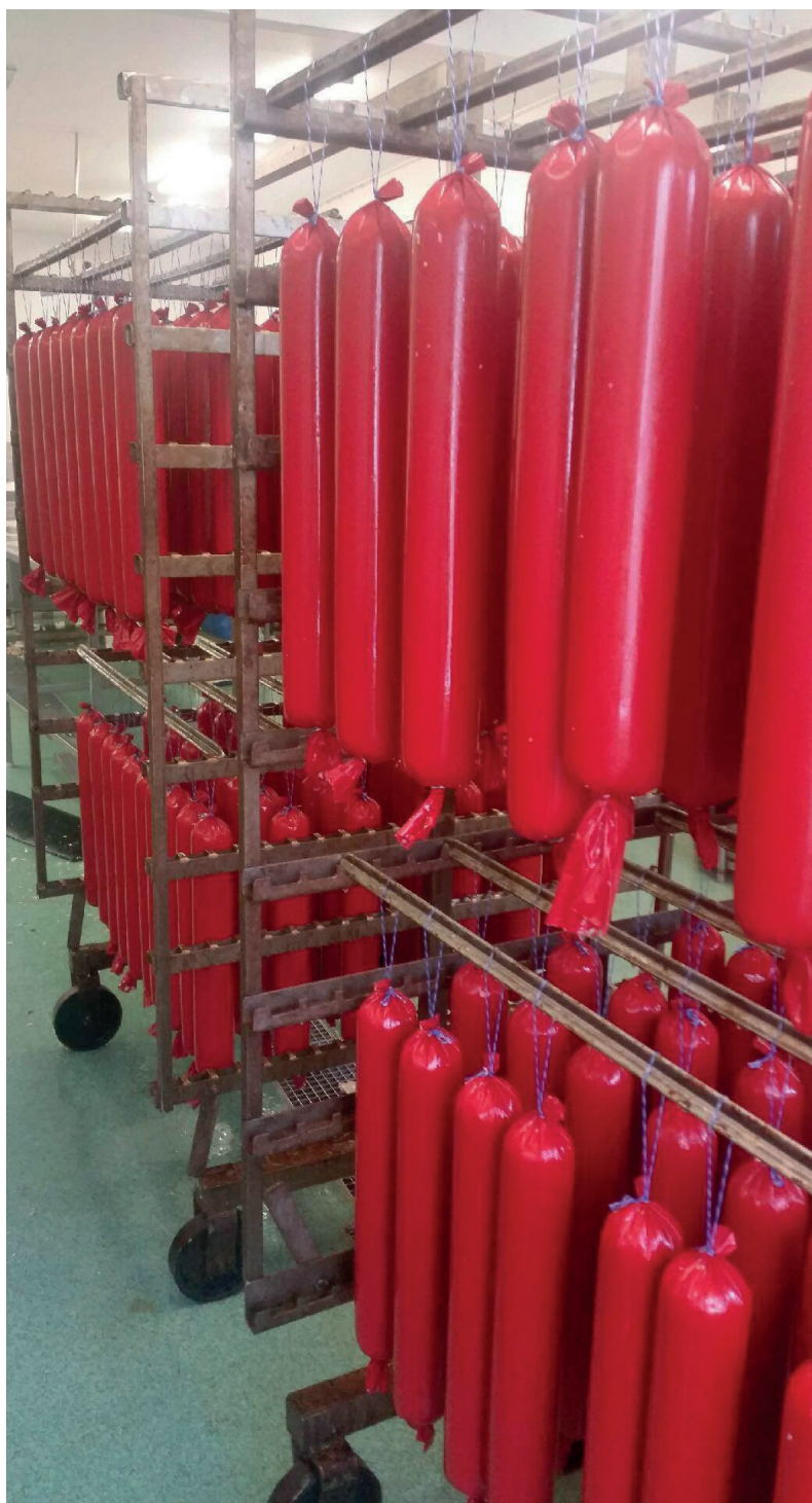
Vår egen falukorv, Sörmlandskorven.

Närproducerade livsmedel som rapsolja, viltkött, viltfärs, lammkött, lammfärs, vetemjöl, honung och egen falukorv. För att vi vill stärka det lokala näringslivet, minska transporterna och belastningen på miljön.